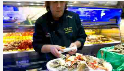
Carote e sedani per la cena afrodisiaca, ma evitate la lattuga