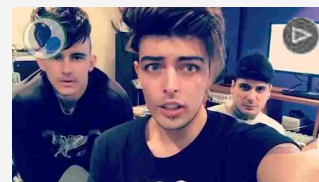
“Io sto con il Regina Margherita Onlus”, lo spot dei personaggi famosi