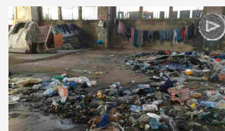
Westinghouse, da super biblioteca è diventata la casa dei disperati