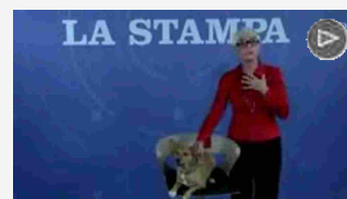
Al Tangram Teatro Torino storie di uomini e cani più o meno famosi fra miti, can...