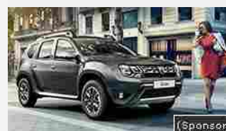
Dacia Duster. A 11.900 €. E con Super Kasko, 3 anni di Kasko a soli 300 €.