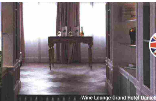
Wine Lounge Grand Hotel Danieli