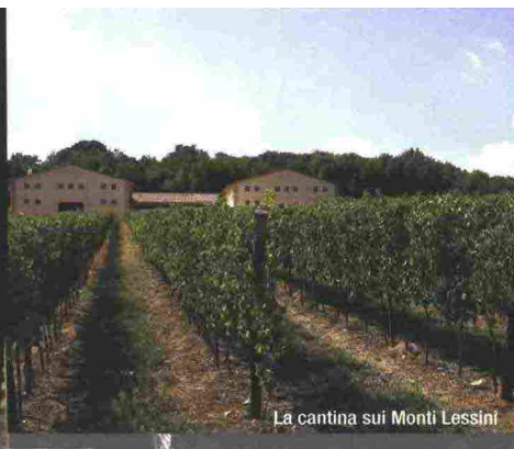
La cantina sui Monti Lessini