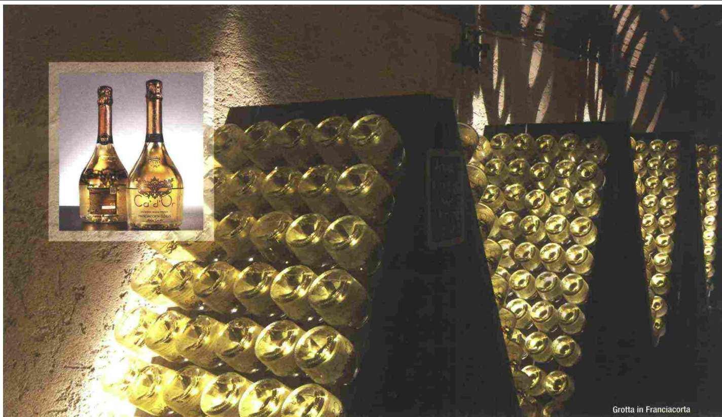
Grotta in Franciacorta

Mentre si è appena conclusa la vendemmia 2015, con risultati, come ci anticipa la proprietà, assolutamente soddisfacenti, Ca' d'Or prosegue nella conquista dei mercati esteri: Las Vegas, New York, Ungheria, Repubblica Ceca. Solo i migliori ristoranti, solo gli hotel più esclusivi per queste raffinate bottiglie, perfetta espressione del loro contenuto